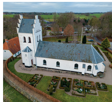
Heden kirke

Se gudstjenestelisten på bagsiden af bladet.