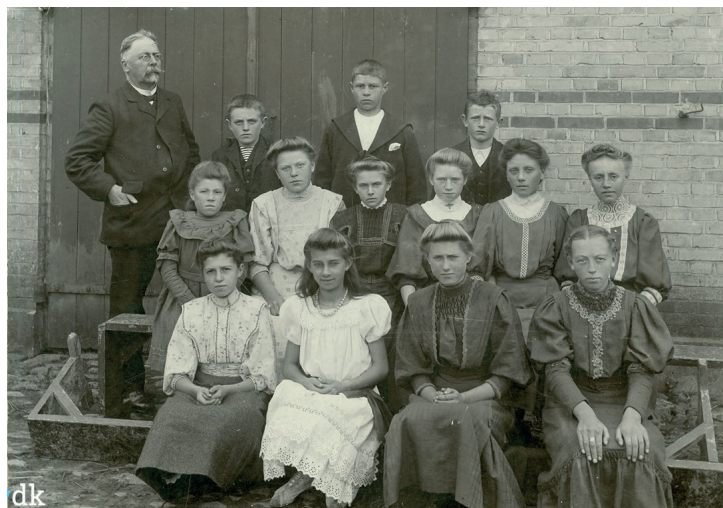
Konfirmander anno 1907 på Fyn.

Nej – er mit modsvar. De unge, der står over for at skulle beslutte at blive konfirmeret, har måske ikke drøftet det i timevis med deres venner, men de har tænkt og overvejet, talt med deres forældre, måske deres lærer, og nu deres præst. Og der er faktisk nogle, der svarer, at de tror på Gud eller på (noget af) det, der står i Bibelen. Det betyder nemlig noget