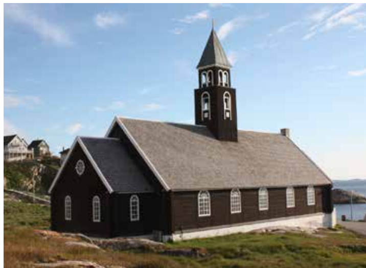
Zion's Kirke, Ilulissat

Da det var klaret i 1981, rejste jeg og min familie til en lille bygd, der hedder Fiskenæsset, som ligger nogenlunde midtvejs mellem Nuuk og Paamiut på vestkysten. Her var jeg præst i tre meget spændende og lærerige år. I 1984 rejste vi så til Ilulissat, som også kaldes Nordgrønlands perle, hvor vi boede og arbejdede i to år, og efter syv år som præstefamilie på Nordvestfyn kom vi igen til Grønland i 1993. Denne gang til Qaqortoq i Sydgrønland, hvor vi var i tre år.