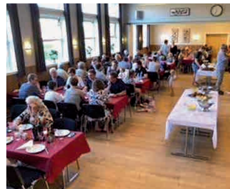
Fællesspisning i forsamlingshuset.