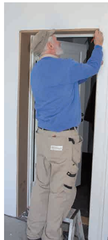
De sidste detaljer monteres.