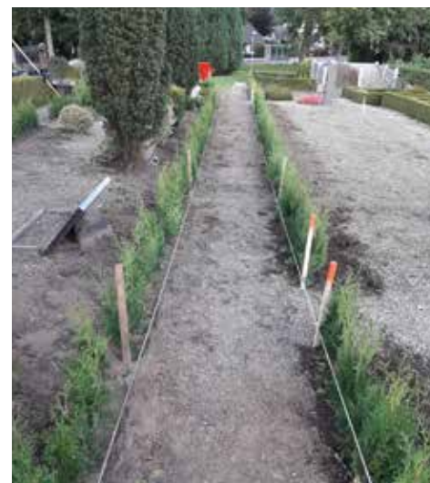
Og her den nyplantede hæk og hvor gangen er bredere.