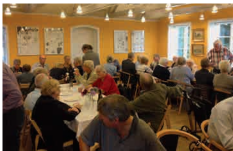
Stemning fra fyraftensgudstjeneste.

Alt det praktiske arbejde med at være arbejdsgiver, planlægge aktiviteter og ombygninger af de eksisterende bygninger, samt deltage i møder m.m., har fyldt meget det sidste år, men nu er det ved at være tid til overvejelser omkring fremtiden for vores sogn. Den egentlige årsag til at de fleste af menighedsrådets medlemmer accepterede at indgå i arbejdet, var at alternativet let kunne blive nedlæggelse af sognet som et selvstændigt