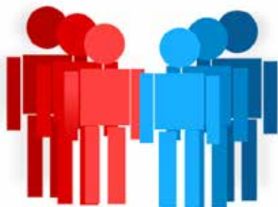
Samvær · Hygge · Oplevelser